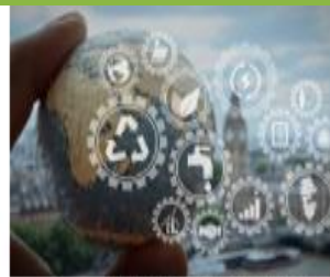
פיתוח מקצועי בקיימות