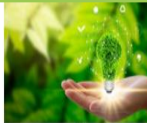
אודות החינוך לקיימות