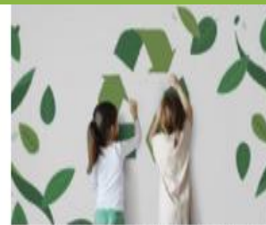
תחרויות ומיזמים סביבתיים