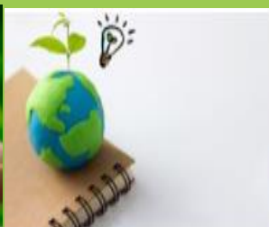
תוכניות בחינוך לקיימות