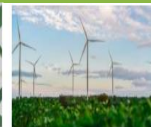
ארגונים וגופים ירוקים