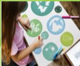
חומרי למידה והוראה