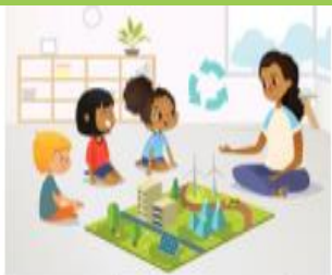
חינוך סביבתי בגני הילדים