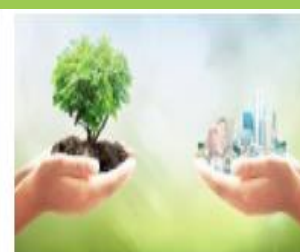
הסמכה ירוקה לבתי ספר